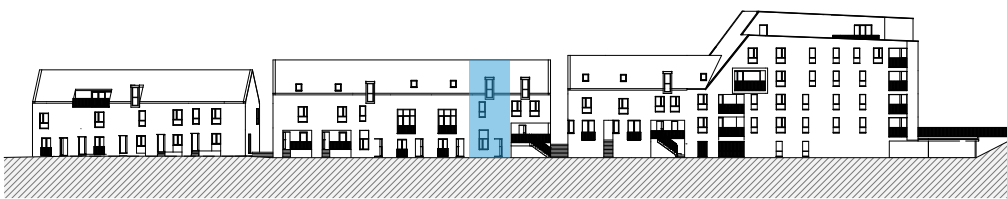
BLOK A - VOORGEVEL - ZUID